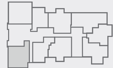
PLAN CLÉ 2e au 6e étage

La superficie brute a été calculée en incluant l'épaisseur des murs périmétriques et la moitié des murs mitoyens. • The gross area was calculated by including the thickness of the perimeter walls and half the common walls. /// La superficie du balcon est exclue des calculs de superficie nette et brute. • The area of the balcony is excluded from the calculation of gross and net area. /// Toutes les dimensions et superficies indiquées sur les plans sont approximatives et sujettes à changements sans préavis. • All dimensions and areas shown on the plans are approximate.